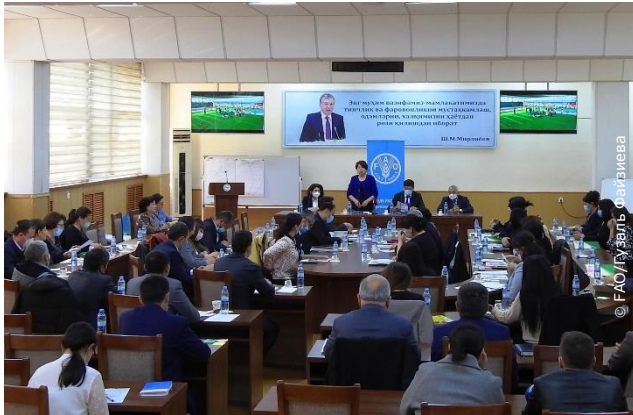
Семинар-тренинг для представителей агропромышленного комплекса Узбекистана

Совместно с Министерством сельского хозяйства Узбекистана ФАО организовала первый семинар-тренинг для представителей агро-промышленного комплекса страны, с целью повышения их потенциала для формулирования решений и реализации мер с учетом гендерного фактора и принципа «не оставляя никого позади». Обучение организовано в рамках проекта ФАО «Поддержка в реализации инклюзивной сельскохозяйственной политики».