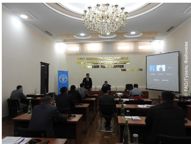
Презентация инновационной системы обмена информацией для пчеловодов

Представительство ФАО в Узбекистане совместно с Ассоциацией пчеловодов Узбекистана организовало встречу с участием представителей Министерства сельского хозяйства для обсуждения инновационной системы обмена информацией, разработанной в рамках Программы технического сотрудничества ФАО «Поддержка устойчивого развития пчеловодства».