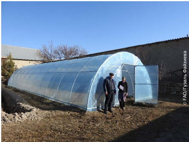
Одна из теплиц, переданных в рамках проекта ИСЦАУЗР-2

ФАО выделила 34 теплицы сельским семьям, проживающим в Бухарской и Кашкадарьинской областях Узбекистана в рамках социально-экономических мер реагирования на глобальный кризис, вызванный пандемией COVID-19.