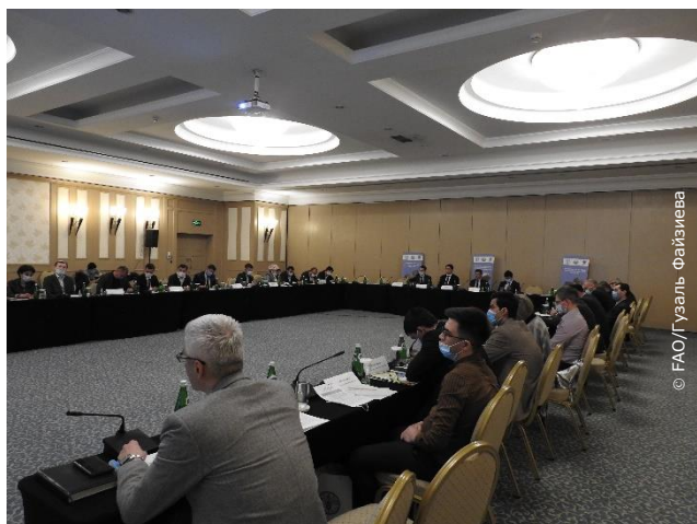
Заседание Координационного комитета проекта ФАО/ГЭФ «Устойчивое управление лесами в горных и долинных районах Узбекистана»

Государственный комитет Республики Узбекистан по лесному хозяйству совместно с Представительством ФАО в Узбекистане провели очередное заседание Координационного комитета проекта ФАО/ГЭФ «Устойчивое управление лесами в горных и долинных районах Узбекистана».