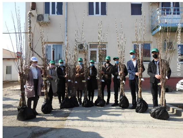
Жители Гулистана с саженцами, переданными Представительством ФАО в Узбекистане