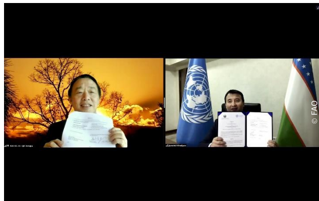
Генеральный директор ФАО Цюй Дунъюй и министр сельского хозяйства Узбекистана Жамшид Ходжаев подписывают соглашение в режиме онлайн