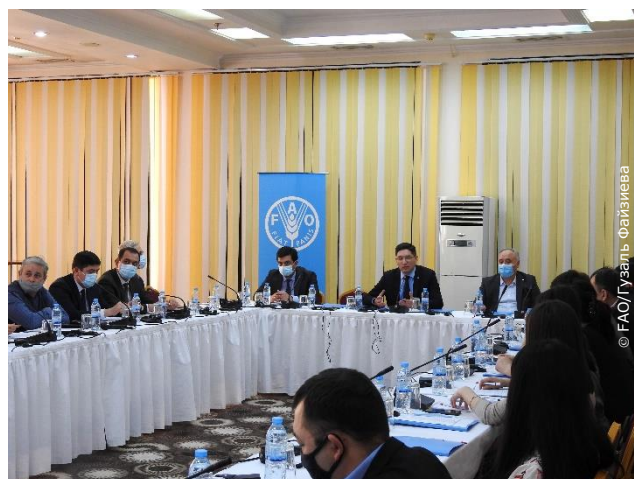
Участники семинара по программе технического сотрудничества ФАО «Восстановление сектора картофелеводства в ответ на кризис COVID-19»

Проект будет реализован в соответствии с Подходом, основанным на правах человека (Human Rights Based Approach, HRBA), который также учитывает гендерные аспекты. Руководящим принципом проекта будет основной девиз Повестки дня в области устойчивого развития на период до 2030 года «Никого не оставлять позади».